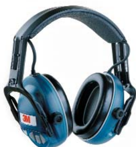
Orejas 3M™ 1520