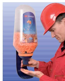
Dispensador de tapones 3M™ 1100 DP