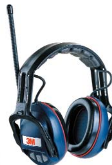
Orejas 3M™ 1515