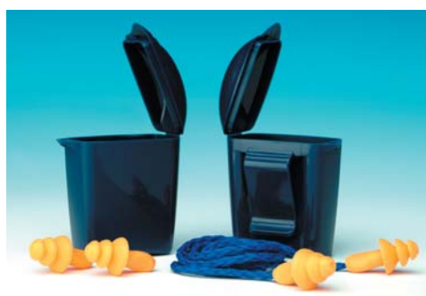
Tapones reutilizables 3M™ 1261 y 1271

Atenuación: 25 dB (SNR) Versiones: 1261 sin cordón 1271 con cordón