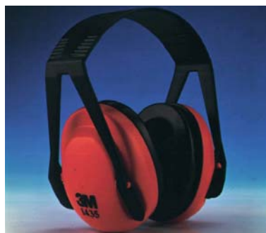
Orejera 3M™ 1435