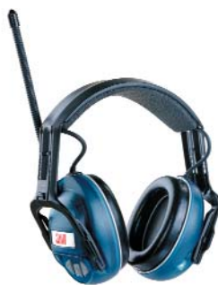
Orejas 3M™ 1510