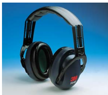
Orejera 3M™ 1440