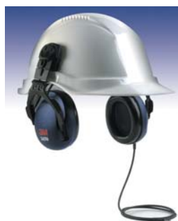
Orejas con entrada audio para acoplar a casco 3M™1450L