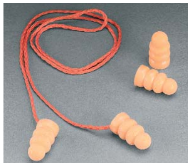
Tapones desechables 3M™ 1120 y 1130