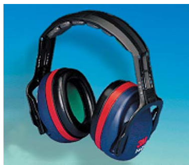
Orejas 3M™ 1445