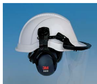
Visor de Policarbonato 3M™ 121 + Combinación Casco-Orejera 3M™ 1460