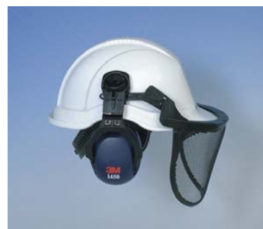
Visor de Malla 3M™ 131 + Combinación orejera-casco 3M 1460