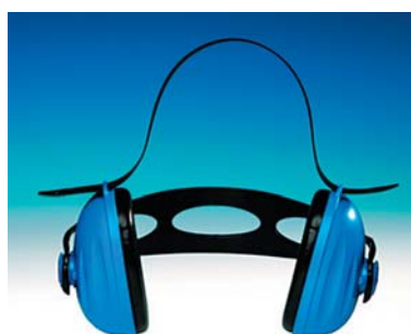
Orejera de doble posición 3M™ 1430