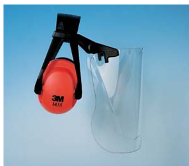
Visor de Policarbonato 3M™ 121 + Orejera 3M™ 1435

Accesorios: Soporte 135, para 3M 1435; Soporte 137, para 3M 1460 y 1465 Clips 138, para 3M 1465