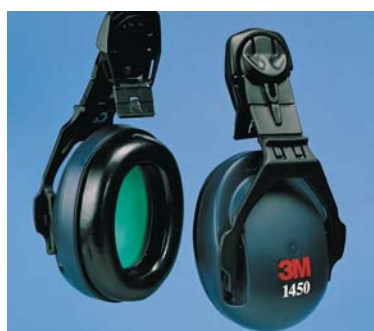
Orejas 3M™ 1450

Atenuación: 26 dB (SNR) Peso: 225 g Accesorios: Kit de higiene 3M 1442 Adaptadores 3M para cascos