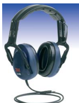
Orejas con entrada audio 3M™ 1440L