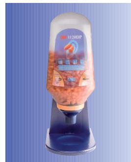
Dispensador de tapones 3M™ 1120 DP