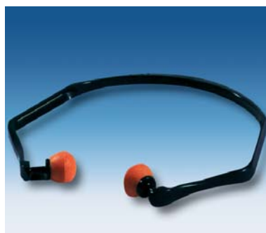
Tapones con banda 3M™ 1310