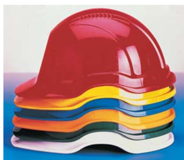
Cascos de Seguridad 3M™ 1465

Accesorios: Barbuquejo 3M 1466 Arnés 3M 1467 Banda de sudor 3M 1468