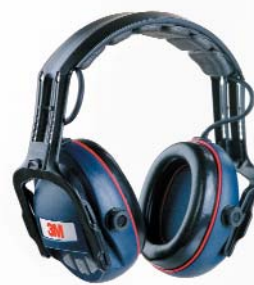
Orejas 3M™ 1525