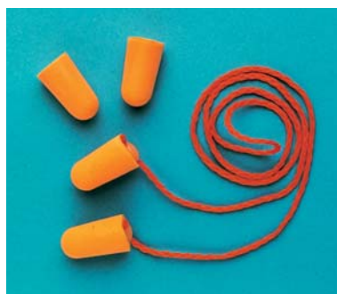
Tapones desechables 3M™ 1100 y 1110

Accesorios: 1120-DP Dispensador pared 1120-R Relleno de tapones Base-DP Base opcional de sobremesa para dispensador