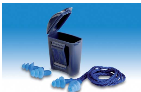
Tapones reutilizables 3M™ 1281 y 1291

Atenuación: 21 dB (SNR) Versiones: 1281 sin cordón 1291 con cordón