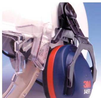
Orejas 3M™ 1455

Atenuación: 31 dB (SNR) Peso: 252 g (orejas) Accesorios: Kit de higiene 3M 1443 Adaptador 3M 112